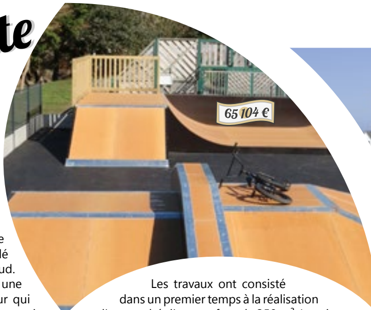
65 104 €

Débuté en 2016 et inauguré le 8 avril dernier, le nouveau Skate Park attire tous les jours de nombreux adeptes de la glisse et rencontre un fort succès. L'ancien Skate Park installé sur l'aire de Runmabil a été démonté. Agé de plus de 15 ans, les modules de saut vétustes ont été déclarés non conformes et irréparables lors de la visite de sécurité fin 2015. Il a alors été décidé de créer un nouveau complexe à Poul-Palud. Installé près du city stade, il constitue une nouvelle attraction de loisirs sur ce secteur qui compte déjà les terrains de football, de tennis et bientôt un parcours de santé couplé à une aire de jeux pour enfants.