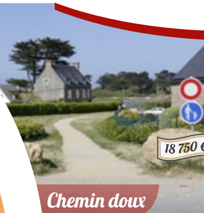
18 750 €

Compte tenu de la dangerosité pour les piétons de la « Rue de l'Île Renote » due à son étroitesse, un chemin doux a été aménagé. Il permet l'accès à l'Île Renote depuis le boulevard du Coz-Pors au bout du parking en herbe du Père éternel.