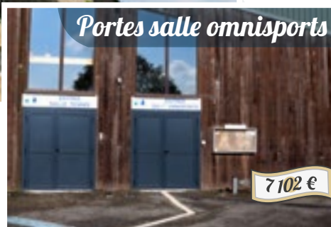
Portes salle omnisports