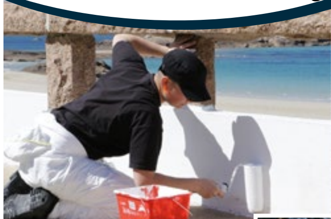
Peinture à la Grève blanche

La mise en œuvre des Chantiers Educatifs Rémunérés est un exemple de réalisation concrète du soutien apporté aux adolescents et jeunes adultes par le SEJS (Service Enfance Jeunesse et Sports) en partenariat avec l'association Beauvallon, Inter'ess, la Mission Locale Ouest Armor et Lannion Trégor Communauté.