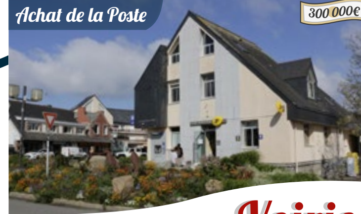
Achat de la Poste

Dans le cadre du futur aménagement du centre-ville, la commune de Trégastel a réalisé l'achat du bâtiment qui abrite les services de La Poste. Cette opération s'est réalisée en octobre pour un montant total de 300 000 euros. Ce bâtiment aujourd'hui hors normes et trop grand est voué à la destruction.