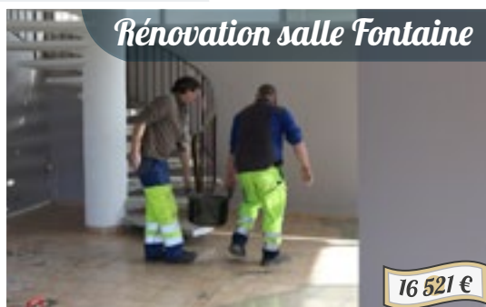
Rénovation salle Fontaine

Une enseigne identifie désormais clairement l'établissement ainsi que ses pratiques.