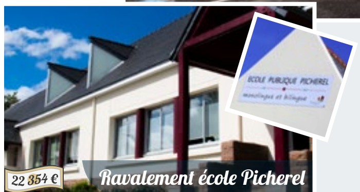
Ravalement école Pichereil