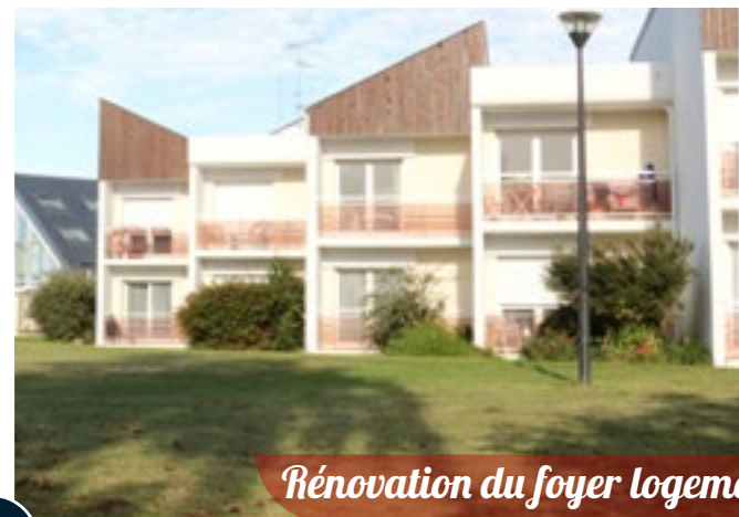
Rénovation du foyer logement