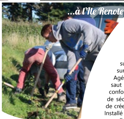
...à l'Île Renote