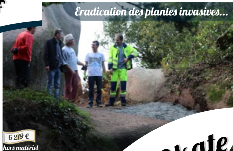
Eradication des plantes invasives...