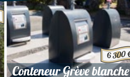
6 300 €