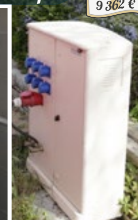
9 362 €